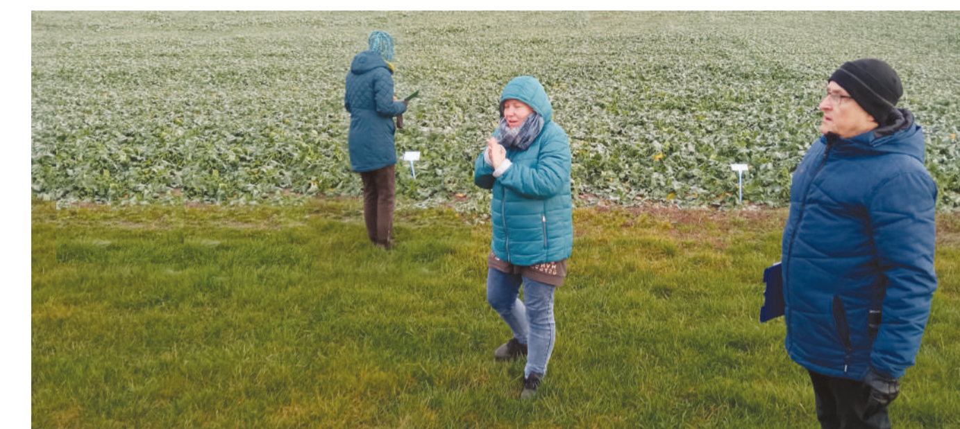
Centrum Doradztwa Rolniczego, jako lider konsorcjum, w ramach którego zawiązano Krajową Sieć Gospodarstw Demonstracyjnych, corocznie organizuje szkolenia z wyjazdami studyjnymi, o zasięgu ogólnopolskim. Szkolenie w woj. mazowieckim w listopadzie 2022 r. z wyjazdem do gospodarstw dla wojewódzkich koordynatorów KSGD oraz doradców współpracujących z Siecią. Na zdjęciu – Pole doświadczalne w Posiewnem.

W grudniu 2022 r. odbył się wyjazd studyjny do woj. warmińsko-mazurskiego. Pierwszego dnia zapoznano uczestniczących rolników z funkcjonowaniem Krajowej Sieci Gospodarstw Demonstracyjnych, a w kolejnych dniach miały miejsce wizyty w czterech gospodarstwach: